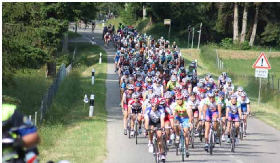
L'équipe au Tour de Guadeloupe.

Sur demande : envoi du bulletin de versement